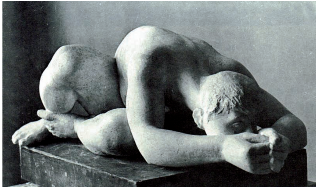
"L'ASSETATO", gesso, cm 35x80x75 - 1948