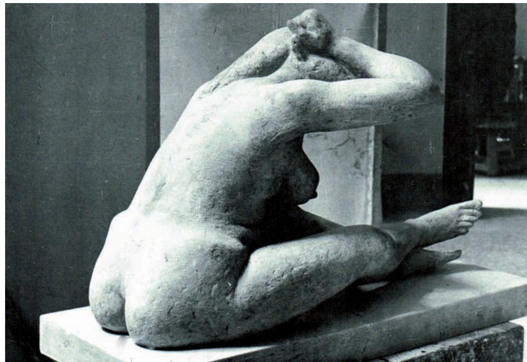
"DONNA CHE SI PETTINA", terracotta, cm 67x100x45 - 1948