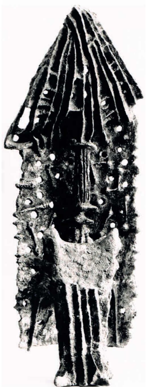
"LA REGINA", cemento e limatura, cm 90x70x25 - 1981